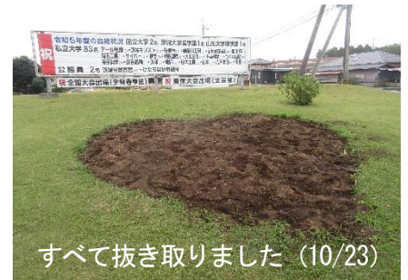
すべて抜き取りました(10/23)