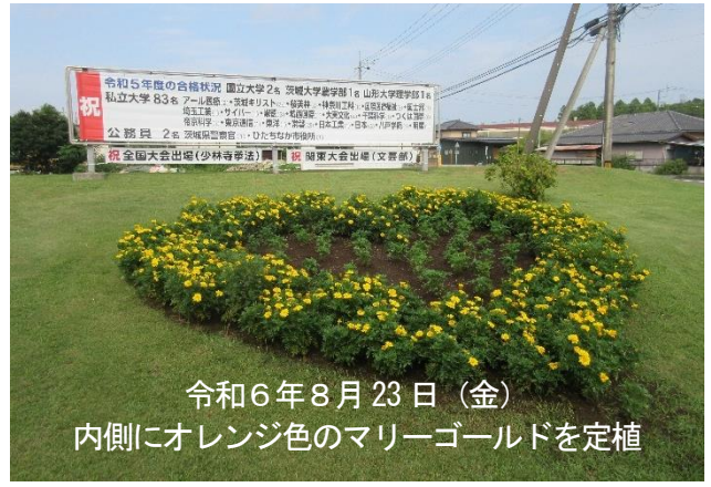
令和6年8月23日 (金) 内側にオレンジ色のマリーゴールドを定植