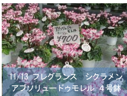
11/13 フレグランス シクラメン アブソリュードウモレル 4号鉢