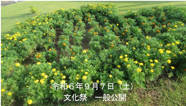
令和6年9月7日 (土) 文化祭 一般公開