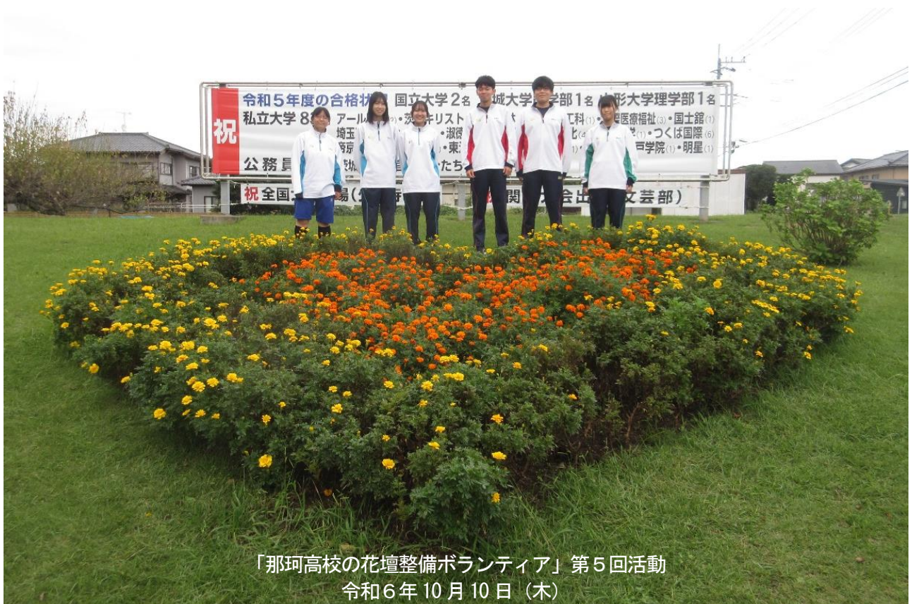
「那珂高校の花壇整備ボランティア」第5回活動 令和6年10月10日(木)