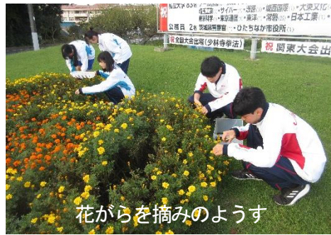
花がらを摘みのようす