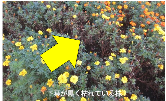
下葉が黒く枯れている株