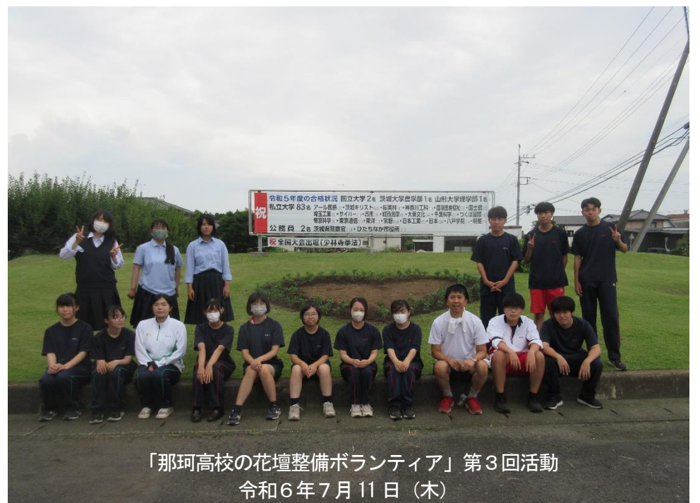
「那珂高校の花壇整備ボランティア」第3回活動 令和6年7月11日（木）