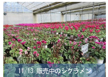
11/13 販売中のシクラメン