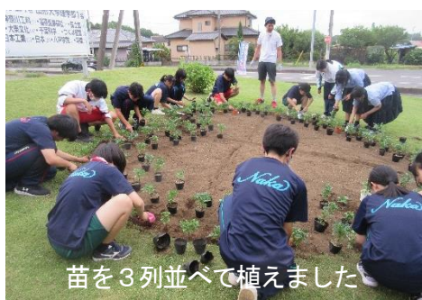
苗を3列並べて植えました