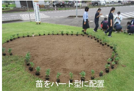
苗をハート型に配置