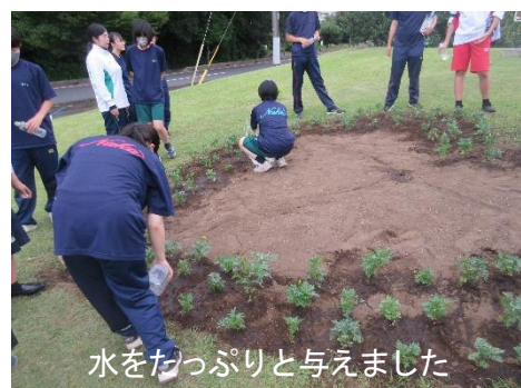
水をたっぷりを与えました