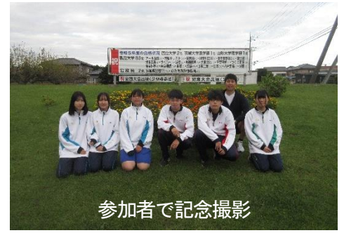
参加者で記念撮影