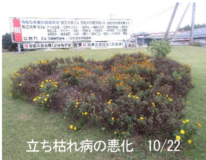
立ち枯れ病の悪化 10/22