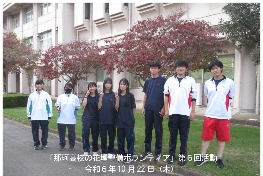
「那珂高校の花壇整備ボランティア」第6回活動 令和6年10月22日(木)