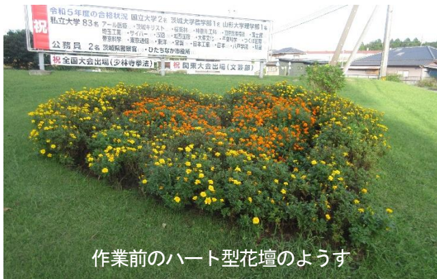
作業前のハート型花壇のようす