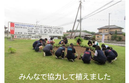
みんなで協力して植えました