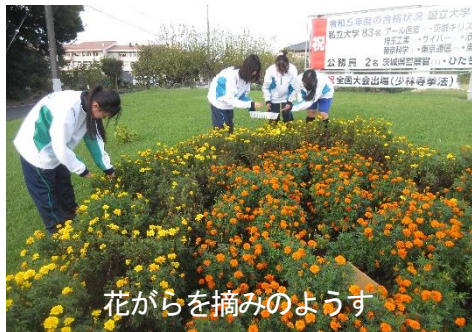
花がらを摘みのようす