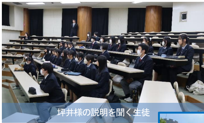
坪井様の説明を聞く生徒