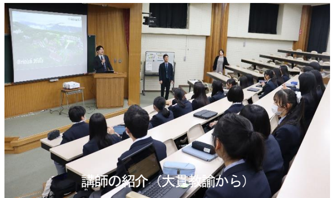
講師の紹介（大貫教諭から）