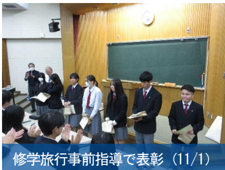
修学旅行事前指導で表彰（11/1）