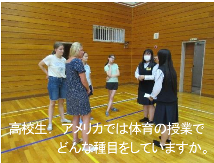
高校生：アメリカでは体育の授業で どんな種目をしていますか。