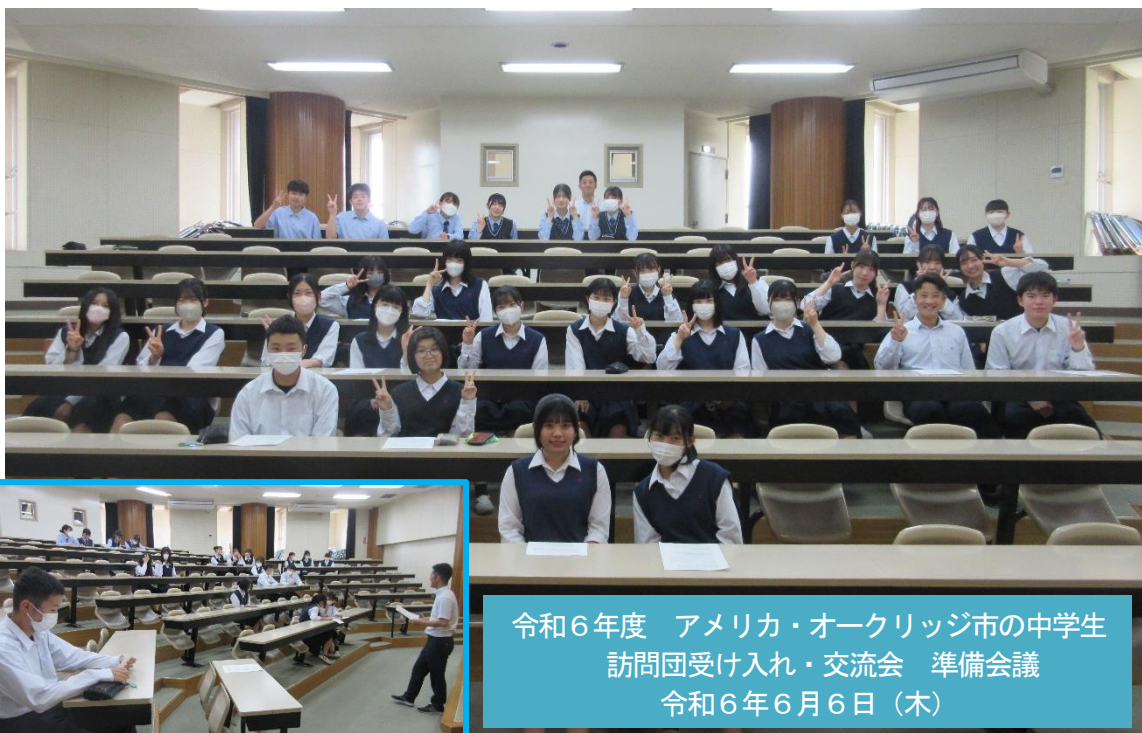
令和6年度 アメリカ・オークリッジ市の中学生 訪問団受け入れ・交流会 準備会議 令和6年6月6日（木）