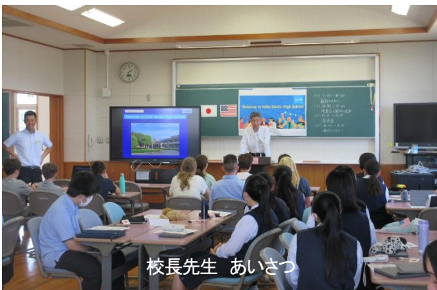
校長先生 あいさつ

「英語が上手になりますように」 「家族が皆、病にかからず元気に長生きできますように」 など