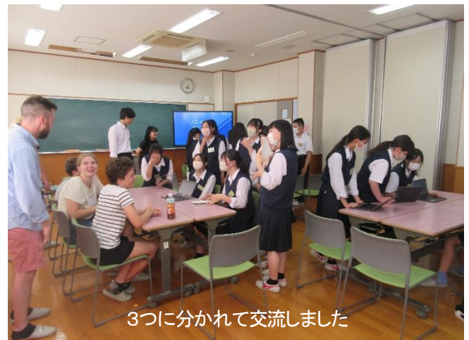
3つに分かれて交流しました