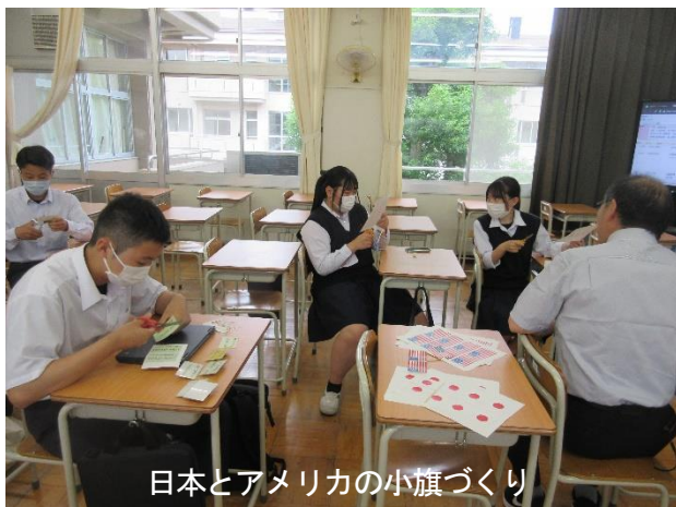
日本とアメリカの小旗づくり