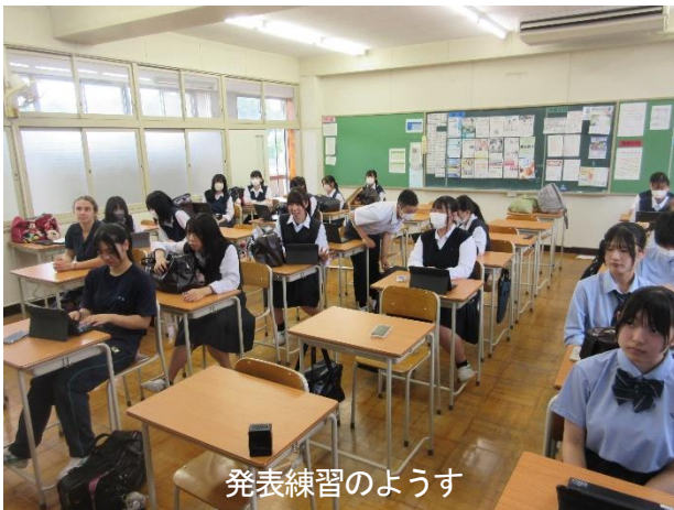
発表練習のようす