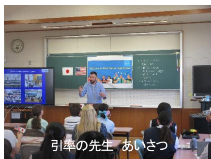
引率の先生 あいさつ