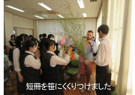
短冊を笹にくくりつけました