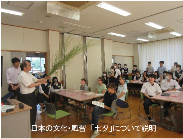
日本の文化・風習「七夕」について説明