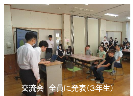
交流会 全員に発表(3年生)