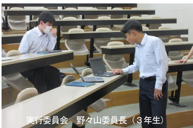
実行委員会 野々山委員長（3年生）