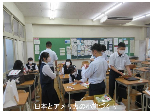
日本とアメリカの小旗づくり