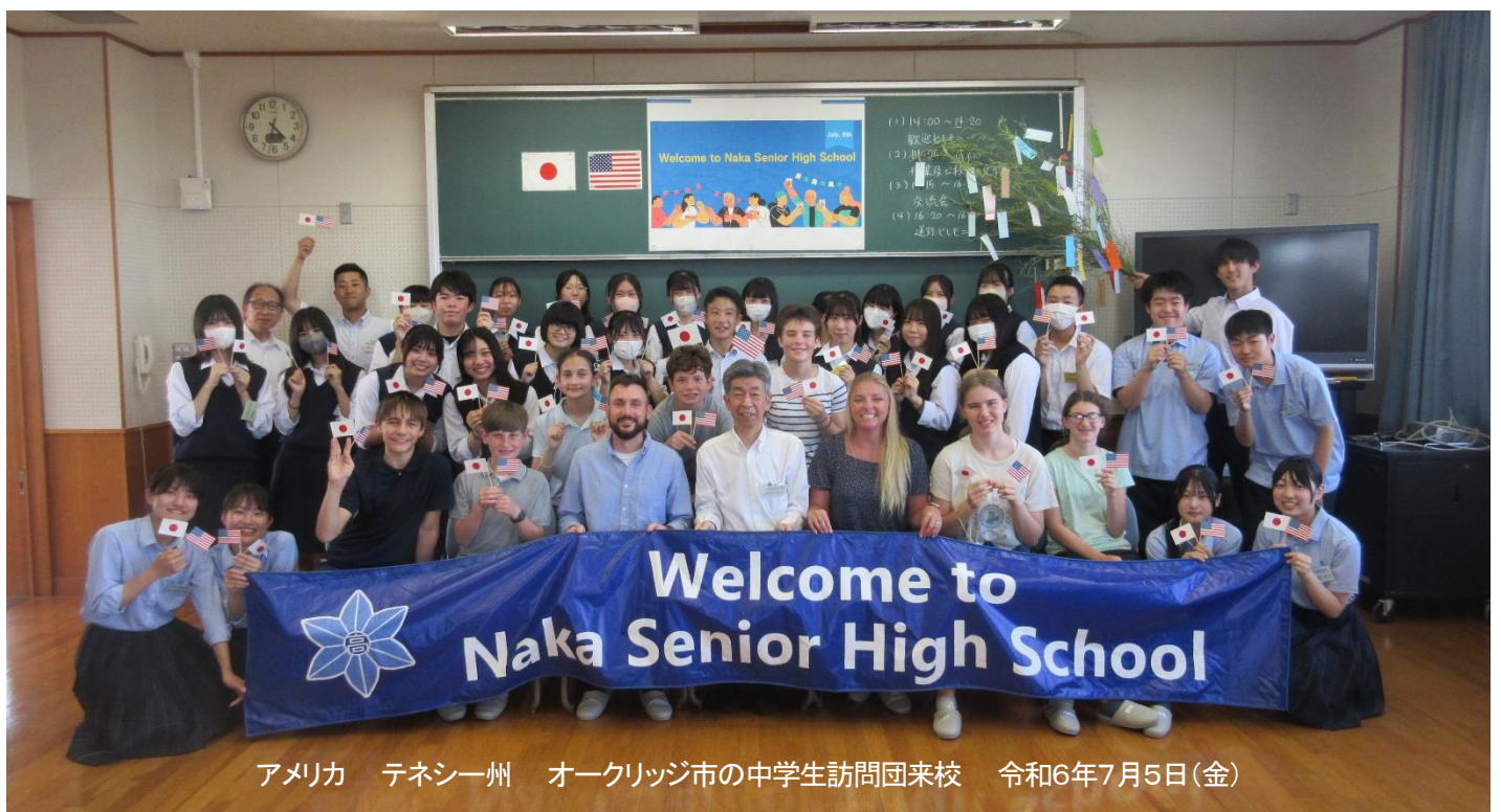
アメリカ テネシー州 オークリッジ市の中学生訪問団来校 令和6年7月5日(金)