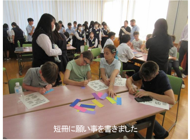
短冊に願い事を書きました