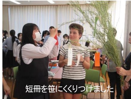
短冊を笹にくくりつけました