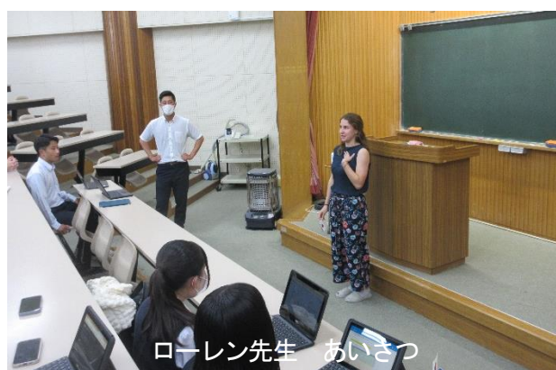
ローレン先生 あいさつ