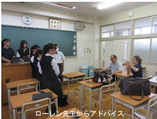
ローレン先生からアドバイス