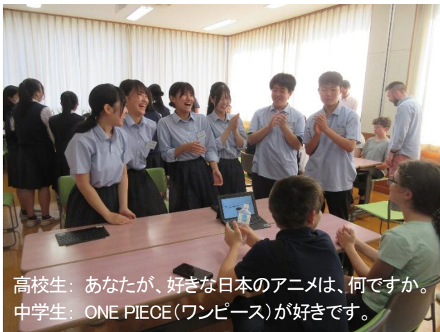
高校生：あなたが、好きな日本のアニメは、何ですか。 中学生：ONE PIECE(ワンピース)が好きです。