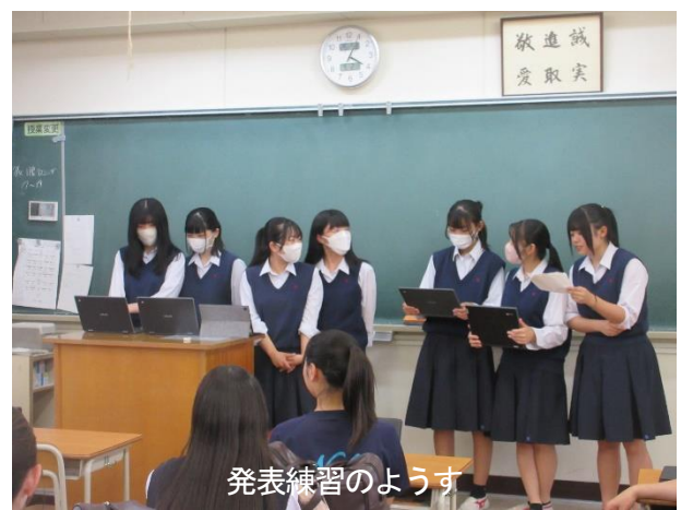
発表練習のようす