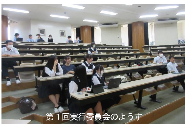
第1回実行委員会のようす