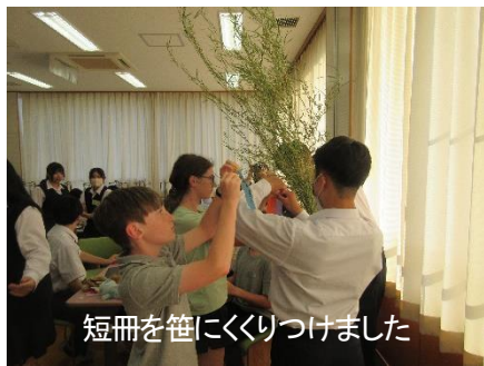
短冊を笹にくくりつけました