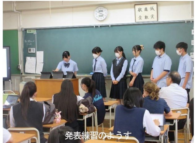
発表練習のようす