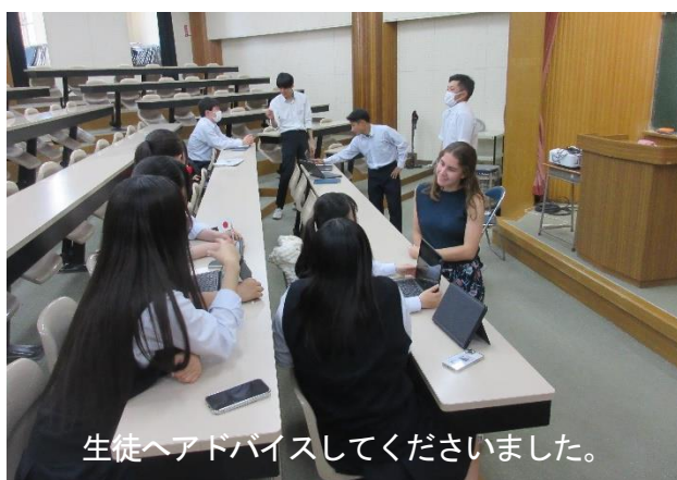
生徒へアドバイスしてくださいました。