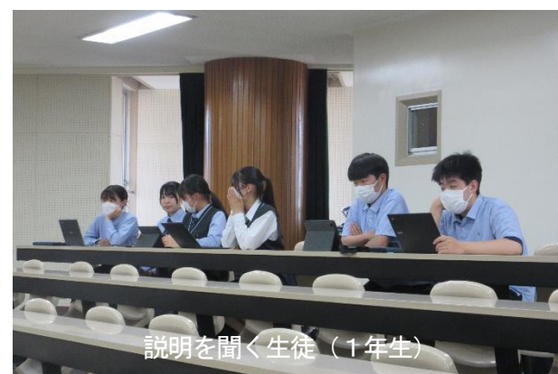
説明を聞く生徒（1年生）